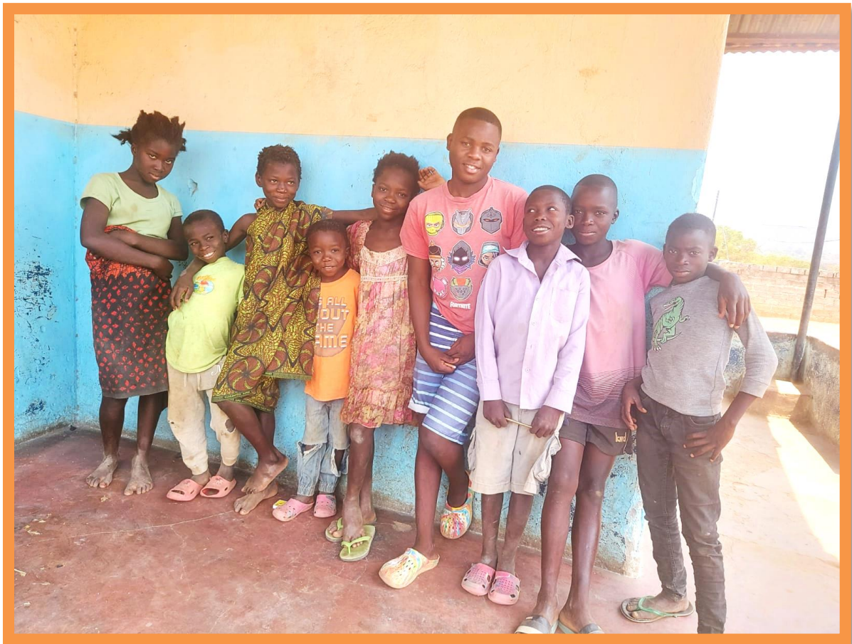
Weeskinderen en kwetsbare kinderen uit Chinsali