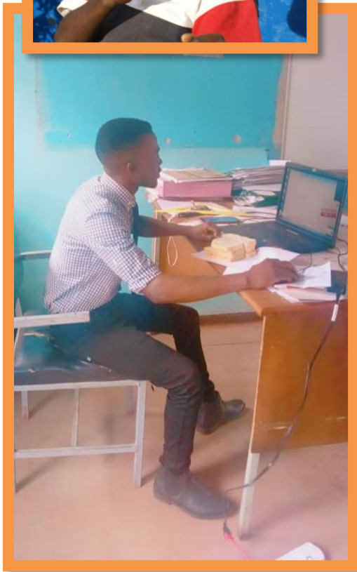
Junior then and now