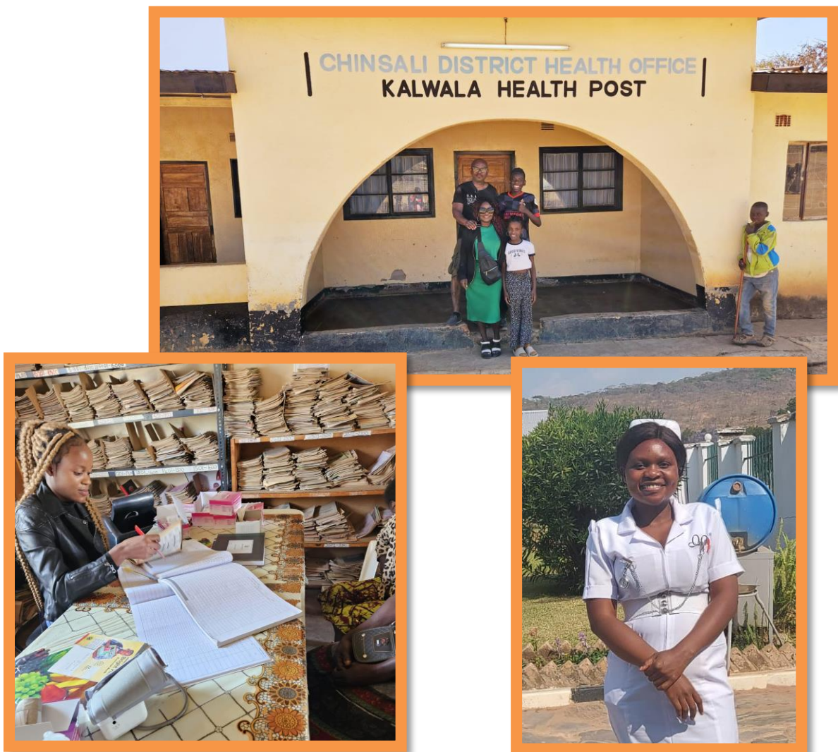
De administratie van de kliniek.

Wel zijn er nogal wat wensen wat betreft de medische uitrusting en de infrastructuur. Er is vooral dringende behoefte aan betere hygiënische voorzieningen zoals toiletten en een wasgelegenheid/douche. Indien onze fondsen toereikend zijn, zullen wij daar in de toekomst zeker proberen aan bij te dragen.