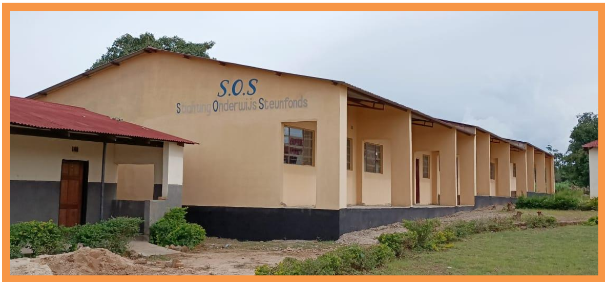
Het science lab, met drie praktijklokalen.

Daar staat dan tegenover dat het gebouw zelf prachtig geworden is. Niet alleen de school is er zeer gelukkig mee, maar het vervult ook een cruciale rol in het onderwijs van de hele provincie als examencentrum.