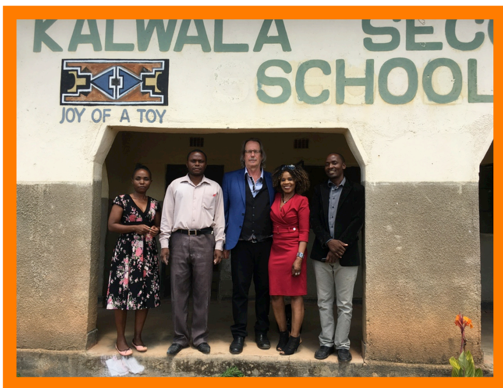
De voorzitter op bezoek bij de wiskunde afdeling. (voor de laatste keer?)

Een flinke tegenvaller is wel dat op het einde van 2018 de voorzitter van de stichting getroffen is door een zwaar hart infarct. Het is hem ten sterkste ontraden om Zambia nog te bezoeken vanwege de medische risico's die dit met zich meebrengt. In de toekomst zal er daarom een alternatief gezocht moeten worden om het persoonlijk contact te blijven onderhouden met de lokale bevolking.