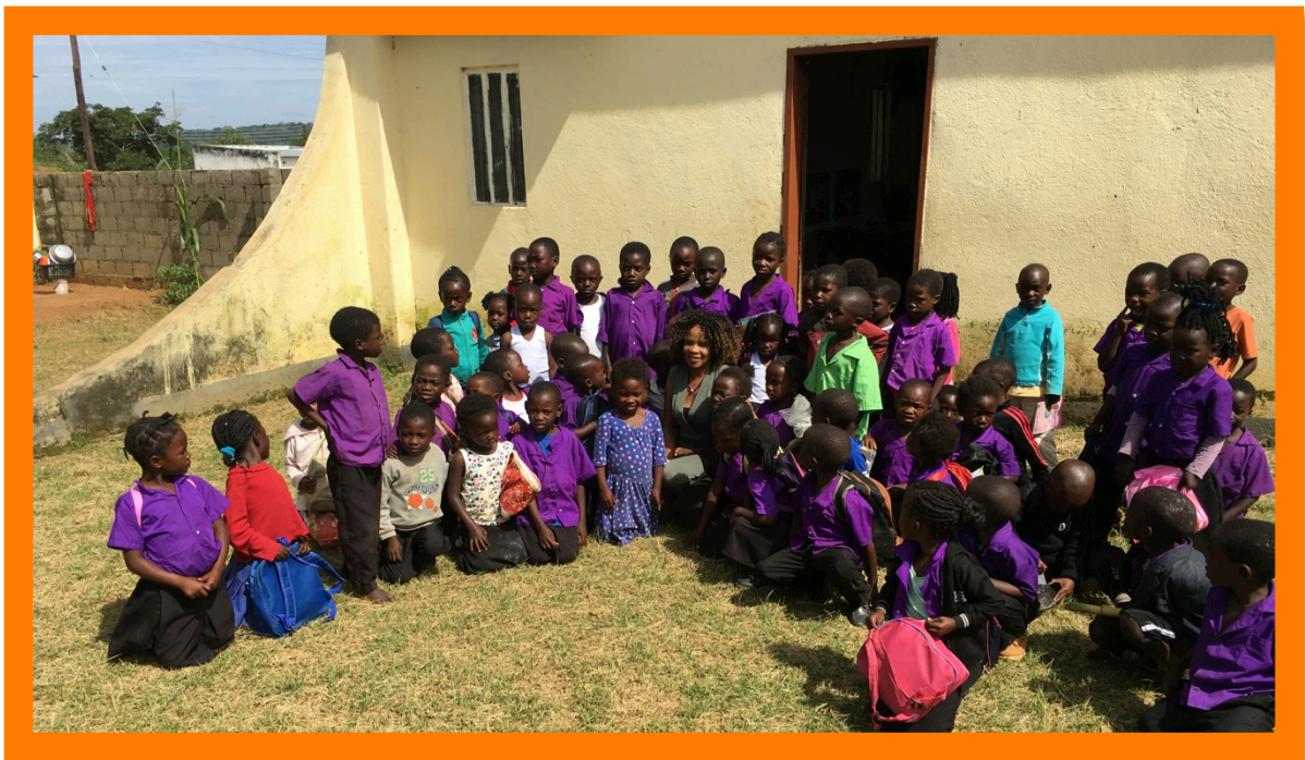
De kleuters van Kalwala.