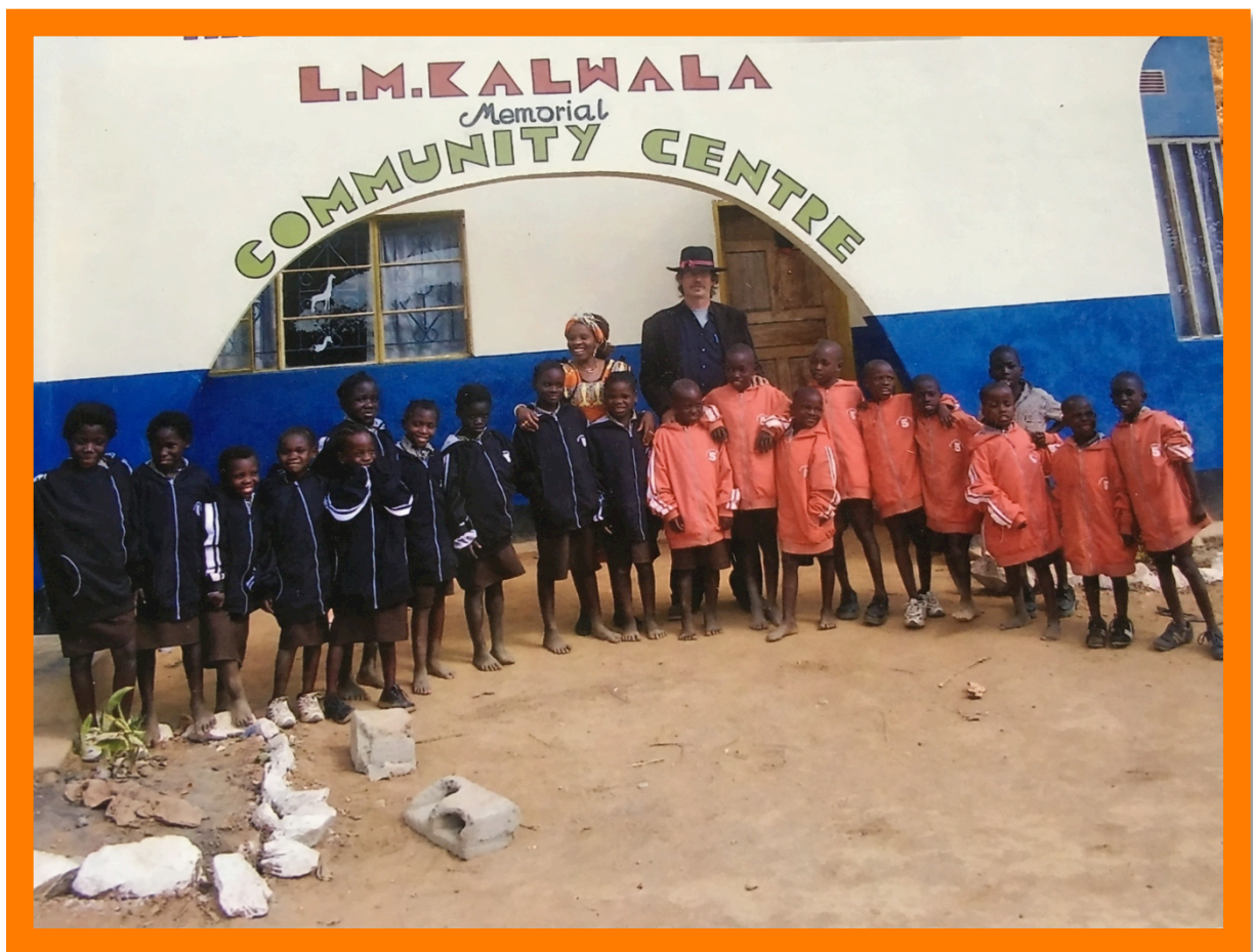
Het begin in 2002.