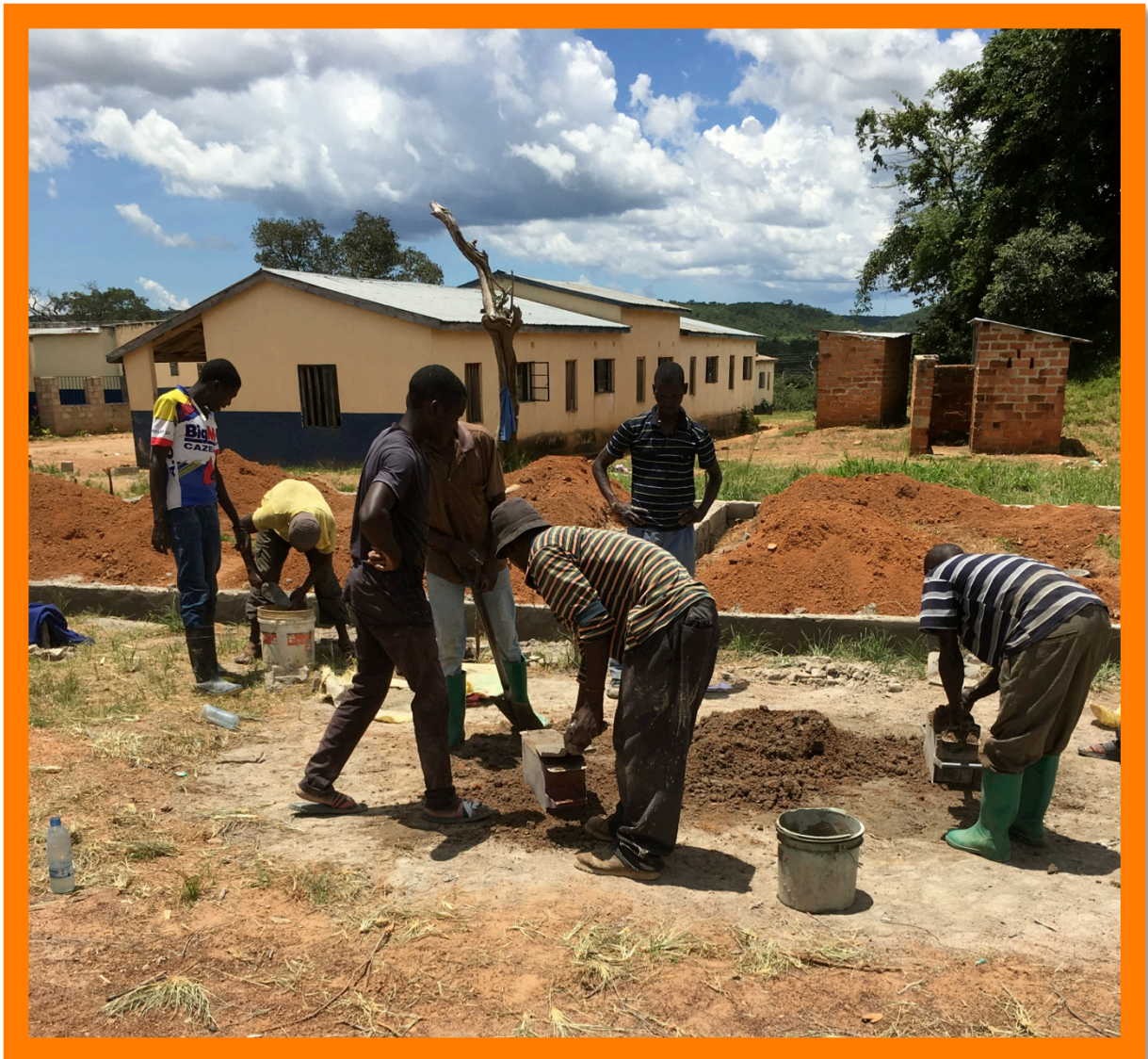
De bouw van de nieuwe klaslokalen.

Met de steun van veel mensen in Nederland is dat ook afgelopen jaar weer gelukt, Daar willen we vanzelfsprekend iedereen voor bedanken, vooral namens alle mensen in het dorp (Kalwala) en omstreken. Want naast de weeskinderen profiteren ook alle anderen van de voorzieningen die het project opgezet heeft. In 2018 zijn er bijvoorbeeld drie extra klaslokalen voor de lagere school gebouwd, omdat het leerlingen aantal maar blijft groeien. Ook de middelbare school breidt steeds verder uit. In 2018 zijn er twee nieuwe lokalen in gebruik genomen en er zijn plannen voor een science laboratorium.