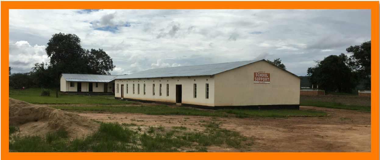
De eetzaal (dining-hal)

Er zijn dit jaar vijf klaslokalen gebouwd en een boys-hostel voor de middelbare school. We hebben dit jaar geen extra docentenhuizen gebouwd omdat het budget dat niet toeliet. De studiekosten van de weeskinderen hebben nu voorrang. Ook zijn er steeds meer docenten die voor zichzelf een huis gebouwd hebben, dus de woningnood onder de docenten neemt gelukkig wat af. De infrastructuur die de overheid beloofd had te realiseren is nog in geen velden of wegen te bekennen. Er waren fraaie plannen om verharde wegen, een waterleiding en verbeterde elektriciteitsvoorzieningen aan te leggen. Voorlopig blijft het bij beloftes.