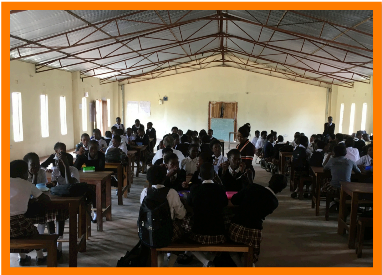
Lunch in de eetzaal.

De samenwerking met deze twee stichtingen is in 2018 weer prima verlopen. De voorzitters hebben constructief overleg gevoerd. Dit heeft geresulteerd in de bouw van een fraai boys-hostel voor de middelbare school. Daar kunnen leerlingen overnachten die te ver van de school vandaan wonen. Dit is een goede stap om uiteindelijk een boarding school te worden. Op die manier gaat de school een steeds belangrijkere rol spelen in de gehele regio en wordt een middelbare school opleiding ook mogelijk gemaakt voor kinderen uit afgelegen rurale gebieden. Wij bedanken de twee stichtingen voor de financiering van dit hostel. De school beschikt nu in totaal over 64 slaapplekken, 32 voor de meisjes en 32 voor de jongens. Ook het lunch project draait na een moeizame start nu op volle toeren.