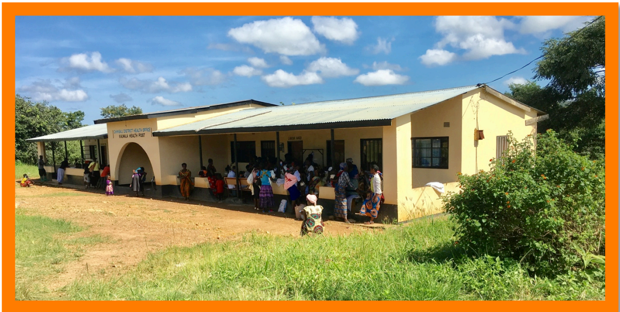
De kliniek in actie.

De kliniek breidt haar diensten steeds verder uit. Men verheugt zich erg op de toekomstige samenwerking met het provinciale ziekenhuis dat in de buurt gebouwd wordt. Met het oog op die samenwerking is de staf flink uitgebreid. De lokale bevolking is zeer te spreken over de dienstverlening. De voorzitter en zijn vrouw hebben met eigen ogen kunnen zien hoe goed de kliniek functioneert. Vooral tijdens de controle van de peuters onder de vier jaar is het er een drukte van belang. Ook de inenting campagnes verlopen voorspoedig.