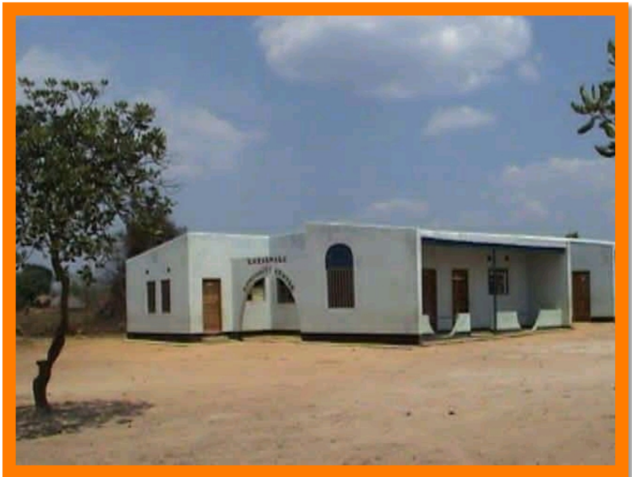
Het begin: Het weeshuis in 2003