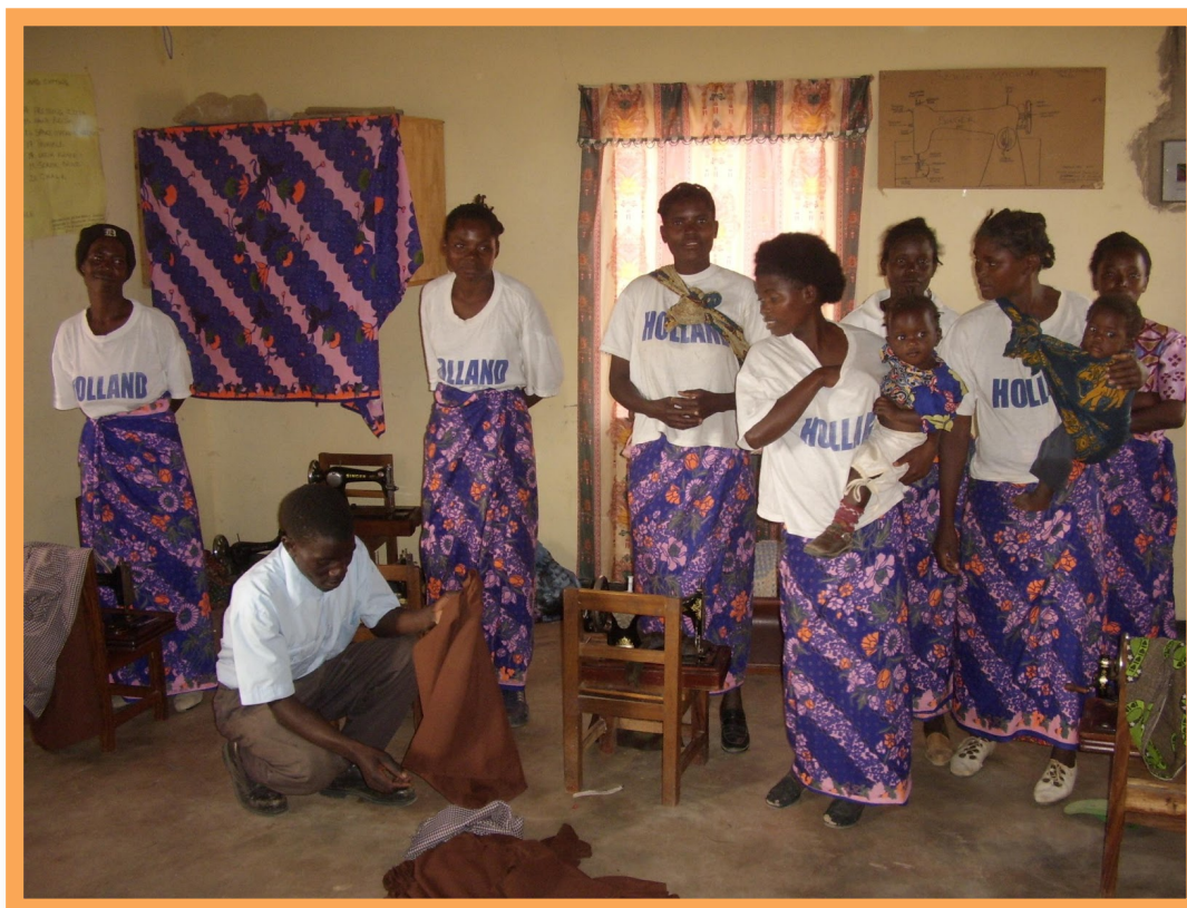
De vrouwenclub in actie.

Totaal levensonderhoud en projectkosten: € 6.214,15