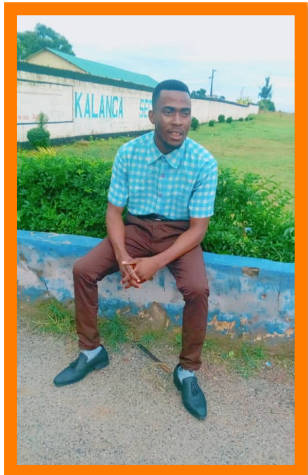
Junior in 2020