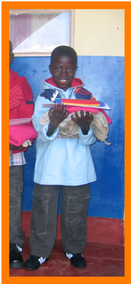
Junior in 2005

Ook voor de kinderen zijn dit onzekere tijden. Scholen worden gesloten, geopend en toch weer gesloten. Dat maakt het studeren moeilijk. Het digitale leren heeft Zambia nog nauwelijks bereikt. Gelukkig zijn alle kinderen gezond gebleven. Voor zover dat vast te stellen is, heeft niemand Corona gehad. Wat ons opvalt in het contact dat we met de kinderen hebben, is dat ze erg verstandig reageren op de gebeurtenissen. Dat is ook logisch. De kinderen die in 2002 in het weeshuis kwamen wonen, zijn nu begin twintig en dus eigenlijk volwassen. Ze voelen zich ook verantwoordelijk voor de nieuwe kinderen. Een aantal van hen heeft al een volwaardige plaats in de maatschappij gevonden en anderen zullen dat doen, zodra ze hun studie afgerond hebben. Aangezien beelden soms meer zeggen dan woorden, volgen hier wat recente foto's van de "kinderen". Ondanks het gemis aan ouders, zijn ze toch gelukkig met het leven. Dat is wellicht het mooiste resultaat dat we met Joy of a Toy bereikt hebben. Een ieder die ons daarbij gesteund heeft, mag daar best trots op zijn.