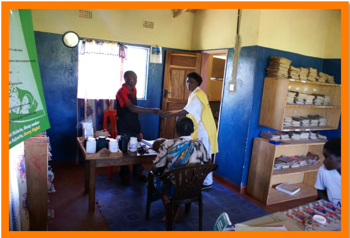
De kliniek in actie.

De kliniek heeft op volle toeren gedraaid. Naast de gebruikelijke dienstverlening hebben ze ook intensief samengewerkt met het nieuwe provinciale ziekenhuis. Dit ziekenhuis is namelijk door de regering aangewezen om alle Covid patiënten in de regio op te nemen. De staf van de kliniek heeft zich uitstekend van deze zware taak gekweten. Naast de gebruikelijke voorlichtingscampagnes heeft de kliniek dit jaar ook veel voorlichting gegeven over de maatregelen die men kan treffen om de verspreiding van Covid tegen te gaan. Daarbij komt het goed uit dat er in het voorgaande jaar al een intensieve campagne gevoerd is op het gebied van hygiëne. Al met al kunnen we rustig stellen dat de kliniek een onmisbaar onderdeel van de gezondheidszorg is gebleken in de afgelopen jaren. Niet alleen in Kalwala Village, maar ook (heel) ver daarbuiten.