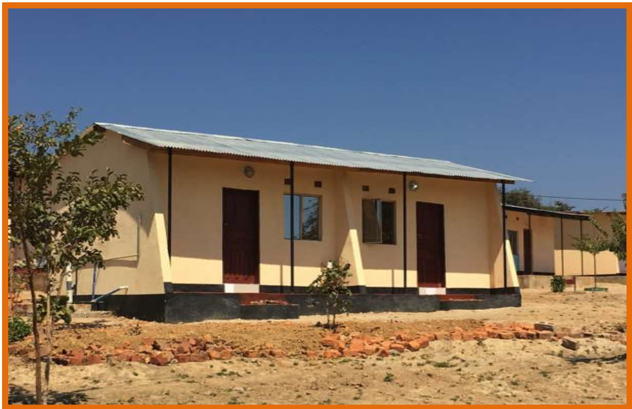
De nieuwe lodge die het comité gebouwd heeft

Ons uiteindelijke doel blijft het toerusten van de lokale bevolking om zelfstandig de leefomstandigheden te verbeteren en te consolideren op het gebied van werk, huisvesting, educatie en gezondheidszorg.