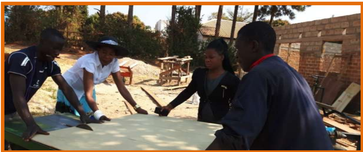
Het Zambiaanse bestuur steekt de handen uit de mouwen