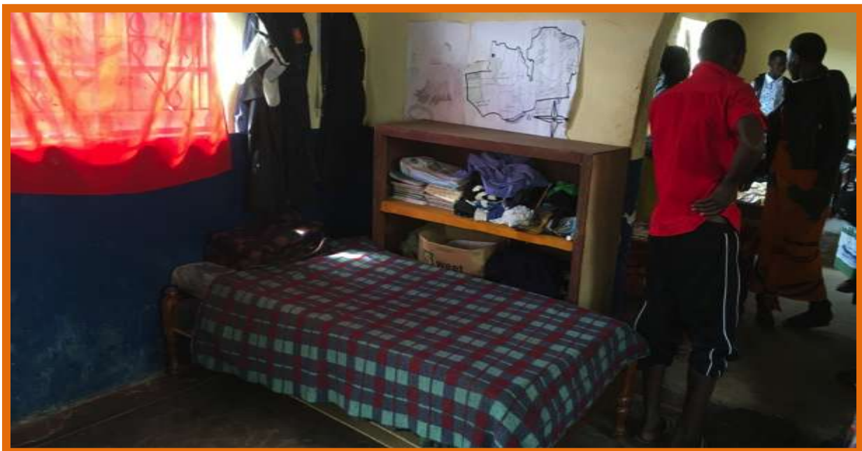
Nieuwe bedden en kasten