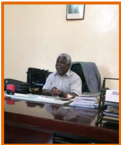
De District Commissioner