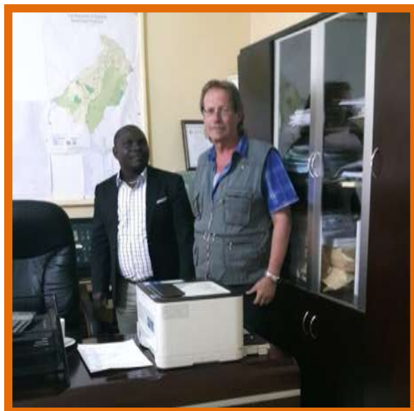
De Provincial Minister