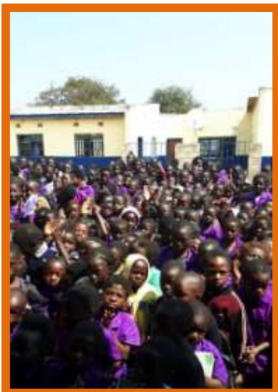
Leerlingen van de lagere school

De scholen blijven groeien. De rol van het ministerie van onderwijs is opvallend. We hebben zeer regelmatig contact over de plannen om de scholen een regionale functie te laten vervullen. Tot nu toe heeft het ministerie echter nog geen bijdrage geleverd aan de infrastructuur. Wel stuurt men bij elke uitbreiding van het leerlingenaantal nieuwe docenten naar Kalwala. Dit jaar hebben we met steun van