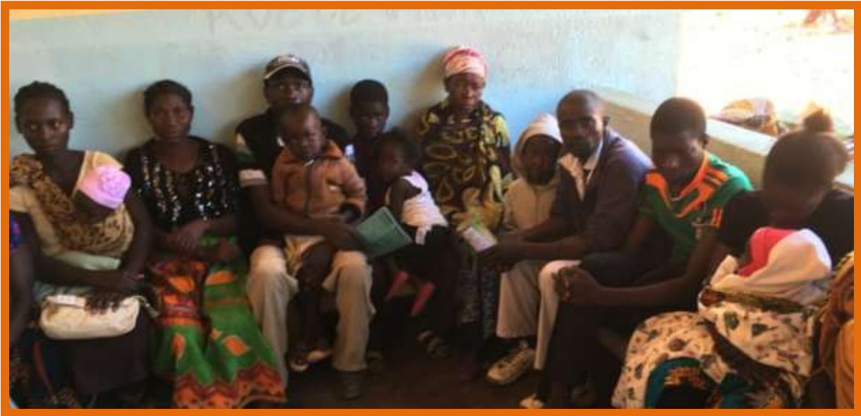
Patiënten van de Janarie kliniek

Dit is het achtste jaarverslag van de stichting Joy of a Toy. Het beschrijft de activiteiten van het jaar 2016. Voor een overzicht van de historie van onze stichting verwijzen we naar het jaarverslag van 2009. Het voornaamste doel van het jaarverslag is het informeren van onze donateurs en andere belangstellenden over de behaalde resultaten. Wij streven naar een zo groot mogelijke transparantie.