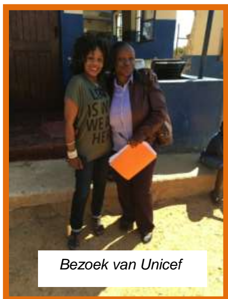
Bezoek van Unicef

maar dat is niet gemakkelijk. Zo is tot op heden nog niets definitief bekend wat betreft eventuele beurzen voor onze kinderen hoewel er van onze kant uit aan alle formele eisen in dit verband is voldaan. Onnodig te zeggen dat dit onderwerp dan ook een van de uitdagingen voor de komende periode is voor onze stichting.