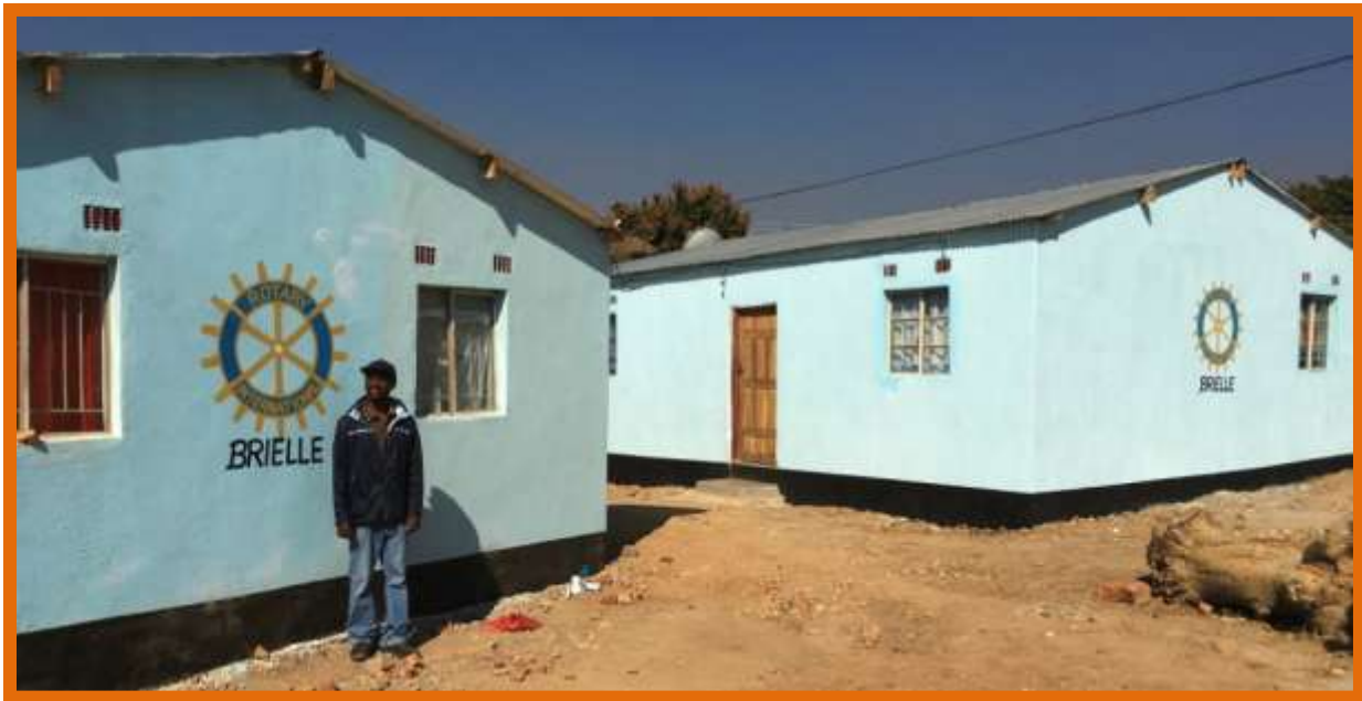
Twee nieuwe docentenhuisen

In Nederland heeft de Rotary Brielle Voorne-Putten Europoort een dictee georganiseerd om ons te ondersteunen. De opbrengst bedroeg 21 000 euro en is gebruikt om stamhuizen te bouwen en om de slaapzalen van de weeskinderen te renoveren. De huur van de huizen wordt gebruikt voor het levensonderhoud van de weeskinderen. We zijn de Rotary veel dank verschuldigd voor deze mooie actie. Onze dank gaat vanzelfsprekend ook uit naar alle anderen die een steentje hebben bijgedragen aan de inspanningen van onze stichting.