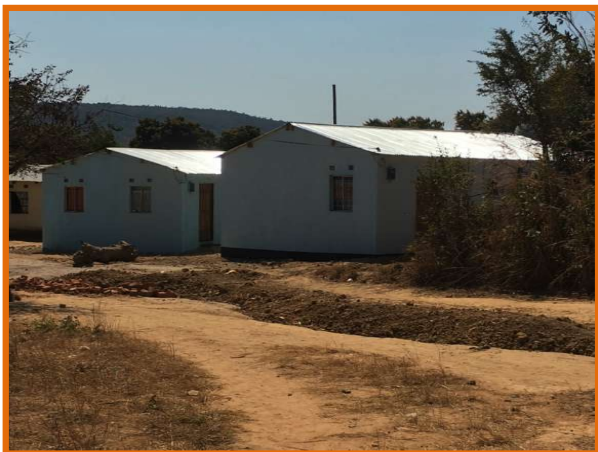
Twee nieuwe docentenhuizen