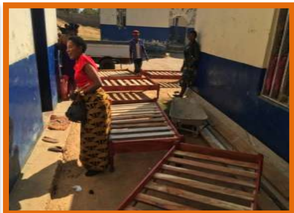
De nieuwe bedden arriveren