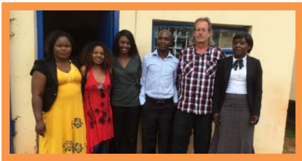
De mensen van het Welfare Office

Zoals reeds vermeld, hebben we dit jaar de contacten met het Welfare Office geïntensiveerd. De Zambiaanse overheid realiseert zich ondertussen dat men ook verplichtingen heeft ten opzichte van de miljoenen minderbedeelde kinderen in het land. Het Welfare Office gaat nauw met ons samenwerken bij het plaatsen en begeleiden van nieuwe weeskinderen. Vertegenwoordigers daarvan hebben het weeshuis bezocht en waren onder de indruk van het werk dat in de afgelopen jaren verzet is. Ook dit jaar is er regelmatig overleg geweest met de Ministeries van Onderwijs, Gezondheidszorg en Planning. Vooral het Ministerie van Onderwijs is zeer actief betrokken bij ons project en ziet de school graag uitgroeien tot een opleidingsinstituut met een belangrijke regionale functie. Ook de contacten met de traditionele leiders in het gebied verlopen uiterst positief.