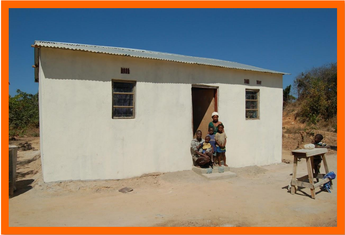
huisje van PeJo

Er zijn twee huizen gebouwd: een docentenhuis en het huisje voor PeJo. Voorts is de grote eetzaal afgemaakt en van elektriciteit voorzien. Datzelfde geldt voor de keuken. Het geld hiervoor kwam grotendeels van de stichting School Support and Beyond, maar ons plaatselijk comité heeft het uitgevoerd. Het voornemen is om in 2018 een jongensslaapzaal te bouwen voor 32 jongens. Momenteel slapen veel jongens die van ver komen in hutjes (of schuurtjes) zonder elektriciteit in het dorp. Op die manier kunnen ze nauwelijks hun huiswerk maken.