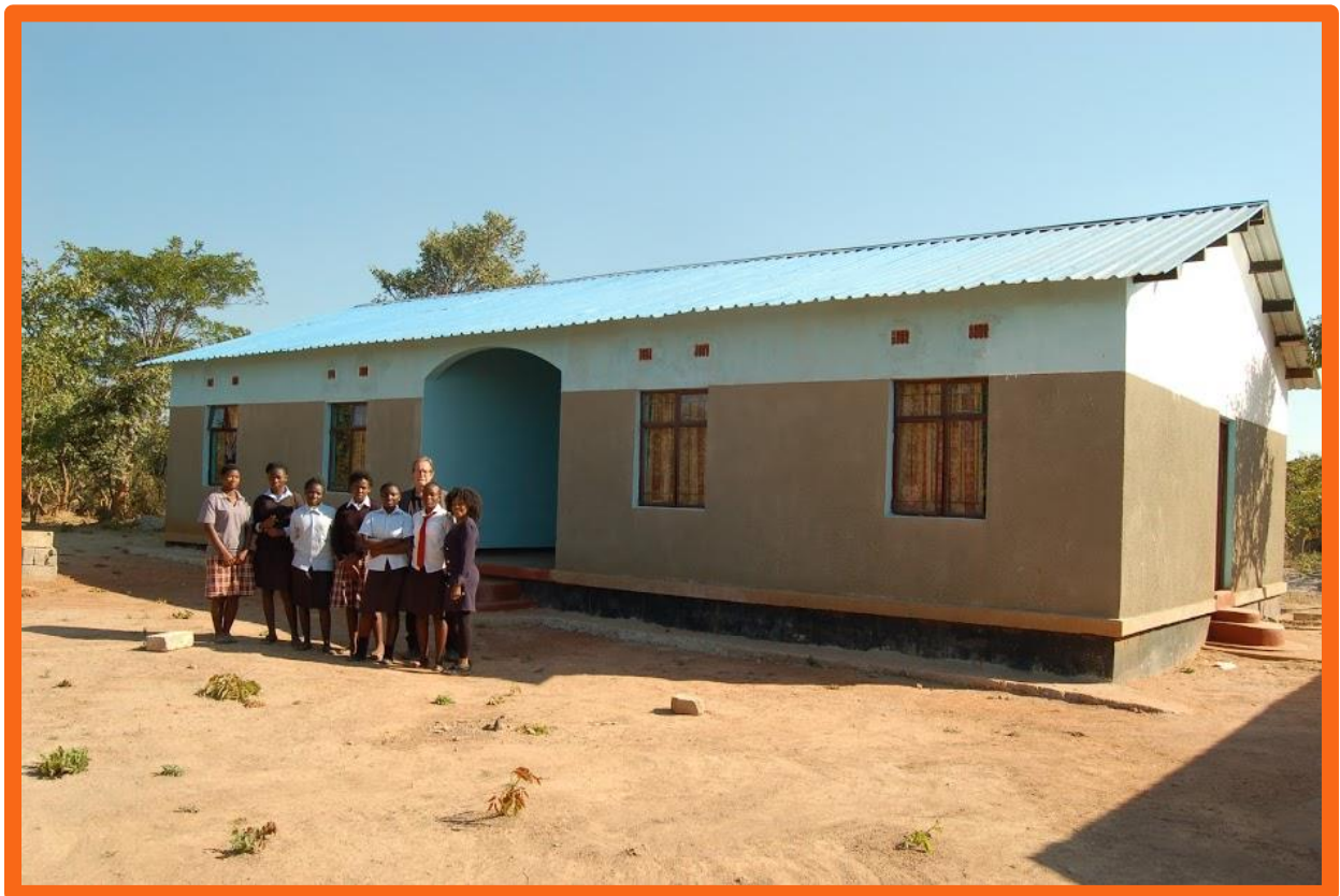
De meisjes slaapzaal.

Zoals reeds eerder vermeld is er dit jaar een begin gemaakt met de bouw van het Science Lab. Het wordt vast een prachtig schoolblok. De inventaris is al aanwezig, dus zodra de bouw voltooid is, kunnen de lessen voor Chemistry, Biology en Physics (Scheikunde, Biologie en Natuurkunde) op een zeer praktische wijze ingevuld worden. En de officiële examens voor deze vakken zullen dan voor alle studenten uit de regio hier plaats gaan vinden. Ondertussen zijn alle stenen voor de bouw reeds vervaardigd en is de fundering gelegd. In 2022 zal het Lab afgebouwd worden.