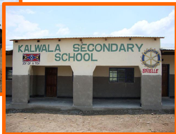
De middelbare school in Kalwala.

Het enige dat nu nog ontbreekt is een Science Laboratory. De regering vraagt al vele jaren of wij daar onze steun aan kunnen verlenen, maar onze financiële middelen zijn daar niet toereikend voor. Het ministerie van onderwijs heeft al wel de inrichting gedoneerd voor een Chemistry, Physics en Biology room.