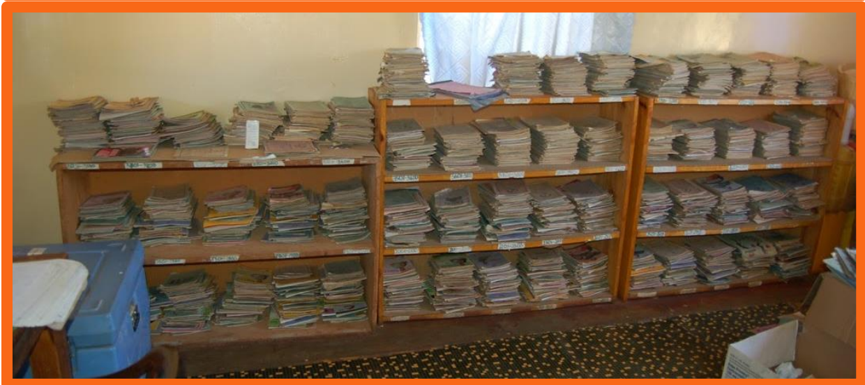
De administratie van de kliniek.