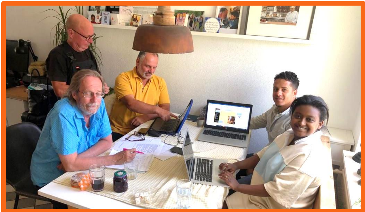
Het bestuur vergadert.

Het bestuur vergadert in principe vier keer per jaar om belangrijke beslissingen te nemen. Bij spoedgevallen consulteert de voorzitter de andere leden per mail en/of telefoon. De volledige statuten zijn te vinden op de website: www.joyofatoy.nl . De stichting is geregistreerd bij de Kamer van Koophandel onder nr. 24446906. In 2021 is op de volgende data vergaderd: 03/01/2021; 17/04/2021; 27/06/2021 en 10/10/2021.