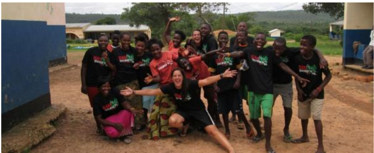
De weeskinderen anno 2014