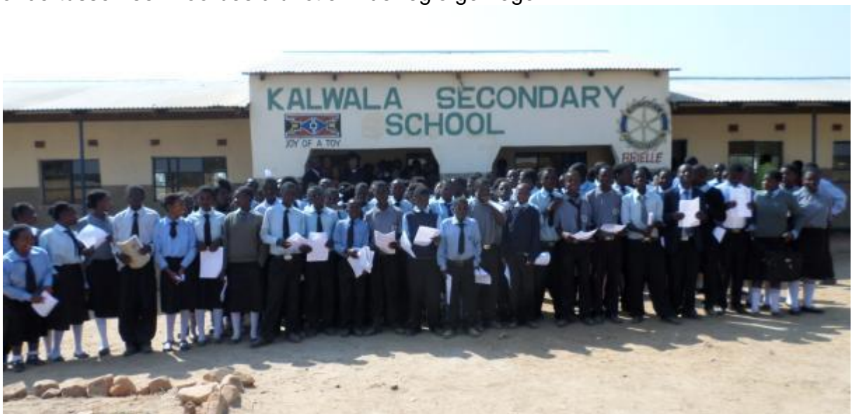
Studenten van Kalwala Secondary School

Op de middelbare school werken nu 22 docenten. Alle scholen in Kalwala hebben ondertussen een voorbeeldfunctie in de regio gekregen.