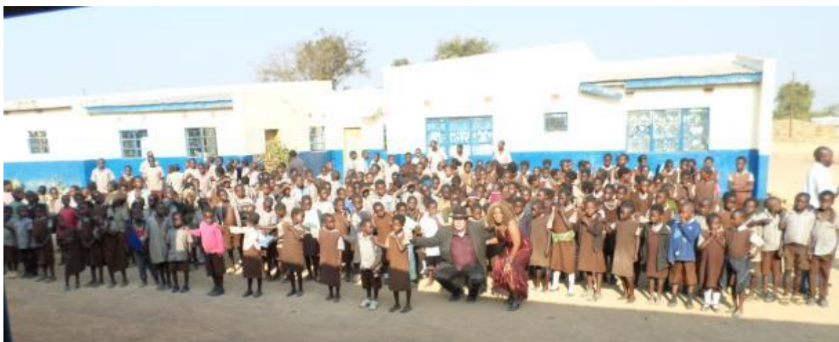
Leerlingen van de Hoge Basic School (lagere school)