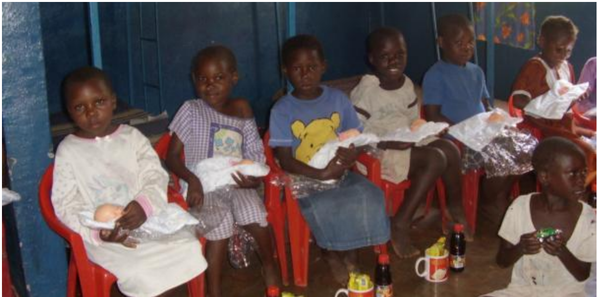
De weeskinderen anno 2004