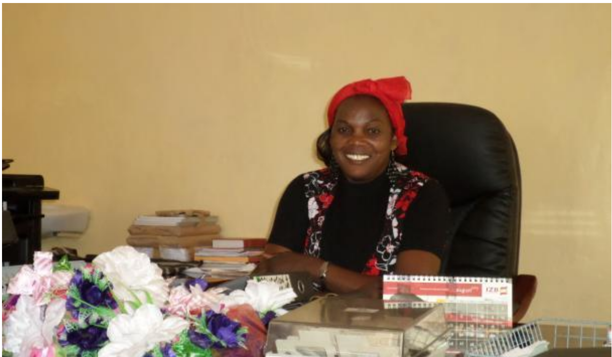
The D.C. (District Commissioner) van Chinsali

Ook dit jaar is er regelmatig overleg geweest met de ministeries van onderwijs, gezondheidszorg en planning. Gelukkig houdt de overheid zich aan haar beloftes om genoeg leerkrachten aan te stellen als de scholen zich uitbreiden. De contacten verlopen in een opbouwende sfeer.