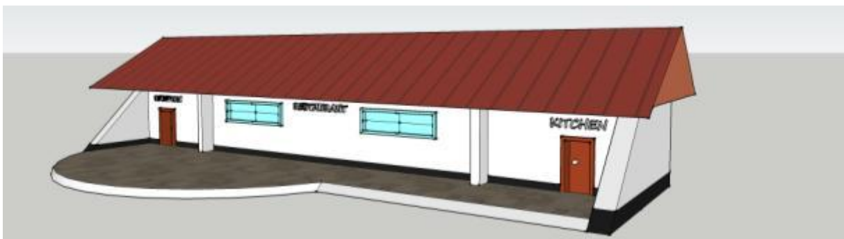
Bouwtekening van het restaurant