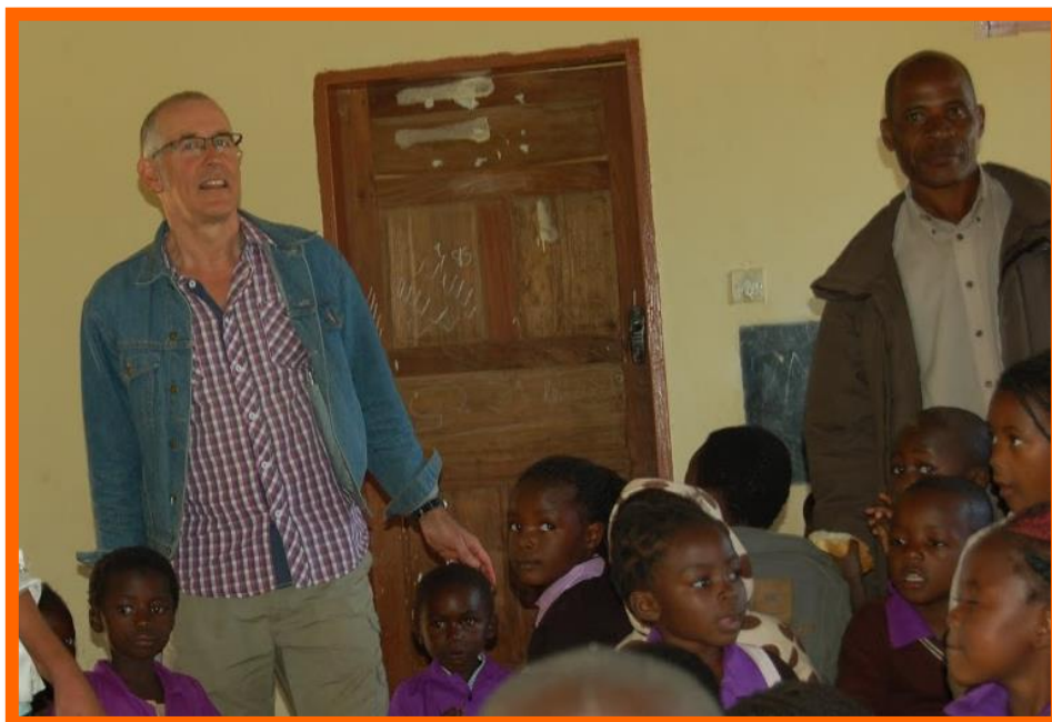
Ger op bezoek in Kalwala

Het bestuur vergadert in principe vier keer per jaar om belangrijke beslissingen te nemen. Bij spoedgevallen consulteert de voorzitter de andere leden per mail en/of telefoon. De volledige statuten zijn te vinden op de website: www.joyofatoy.nl . De stichting is geregistreerd bij de Kamer van Koophandel onder nr. 24446906. In 2019 is op de volgende data vergaderd: 27/01/2019, 29/04/2019, 13/07/2019 en 6/10/2019.