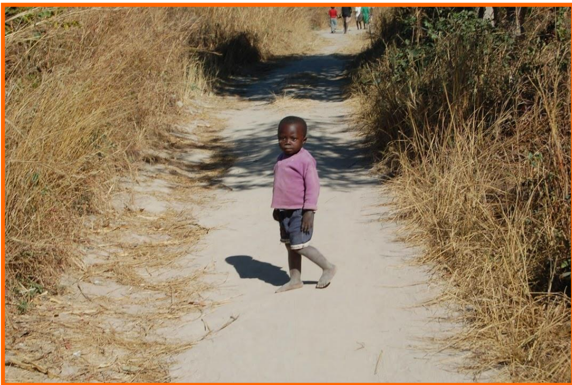
Een schone omgeving.

Ook speelt de kliniek een goede rol in het voorlichten van de bevolking. Zo hebben ze samen met de Nederlandse studenten gewerkt aan een campagne om de omgeving schoon te houden van afval. Dat is essentieel voor de hygiëne en dus ook de gezondheid in het dorp.