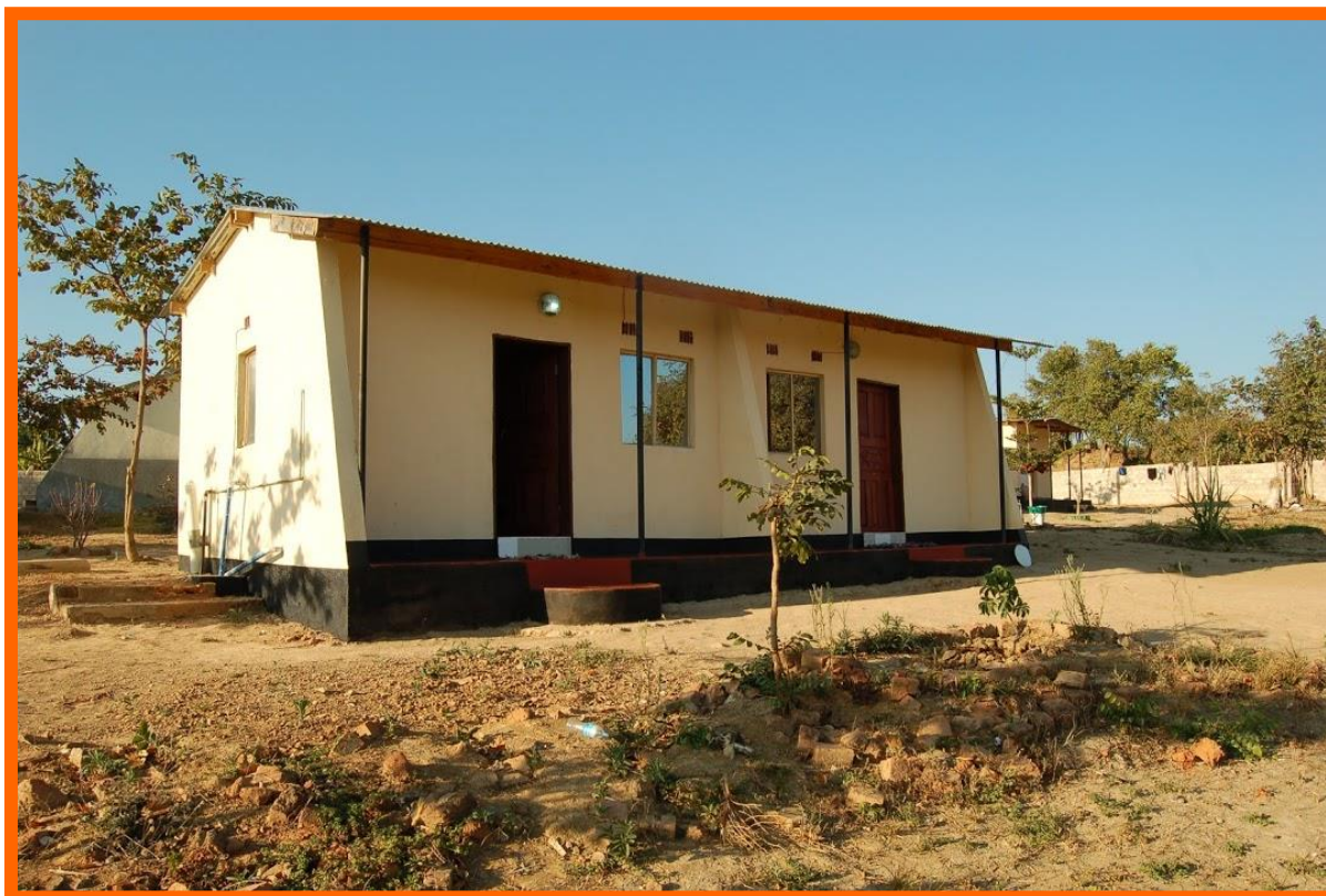
Eén van de lodges in het dorp.

Alle andere initiatieven op het gebied van onderwijs en gezondheidszorg verlopen ook voorspoedig. Waar we vooral blij mee zijn als stichting is het feit dat de zelfredzaamheid van de dorpsbevolking toeneemt. Daar leveren de nieuwe visvijvers ook een belangrijke bijdrage aan. Dit is een project van de lokale bevolking zelf en dat is precies waar we altijd op gehoopt hebben: dat de mensen in Kalwala nieuwe manieren vinden om aan de armoede te ontsnappen. Verschillende dorpsbewoners hebben fraaie groentetuinen aangelegd en verkopen hun groenten op de lokale markt. Ook de verhuur van de lodges zorgen voor wat bescheiden inkomsten, die aangewend worden voor de studie van de weeskinderen.