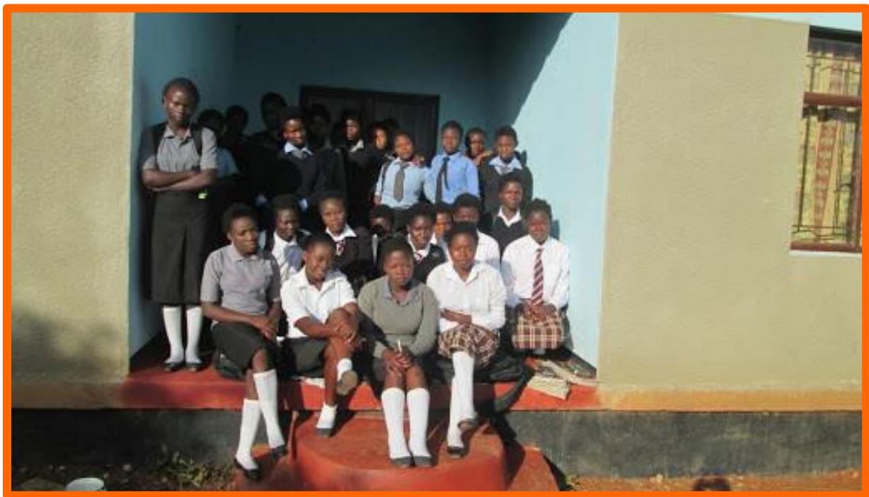
Girls-hostel bij de secondary school

Ons uiteindelijke doel blijft het toerusten van de lokale bevolking om zelfstandig de leefomstandigheden te verbeteren en te consolideren op het gebied van werk, huisvesting, educatie en gezondheidszorg.