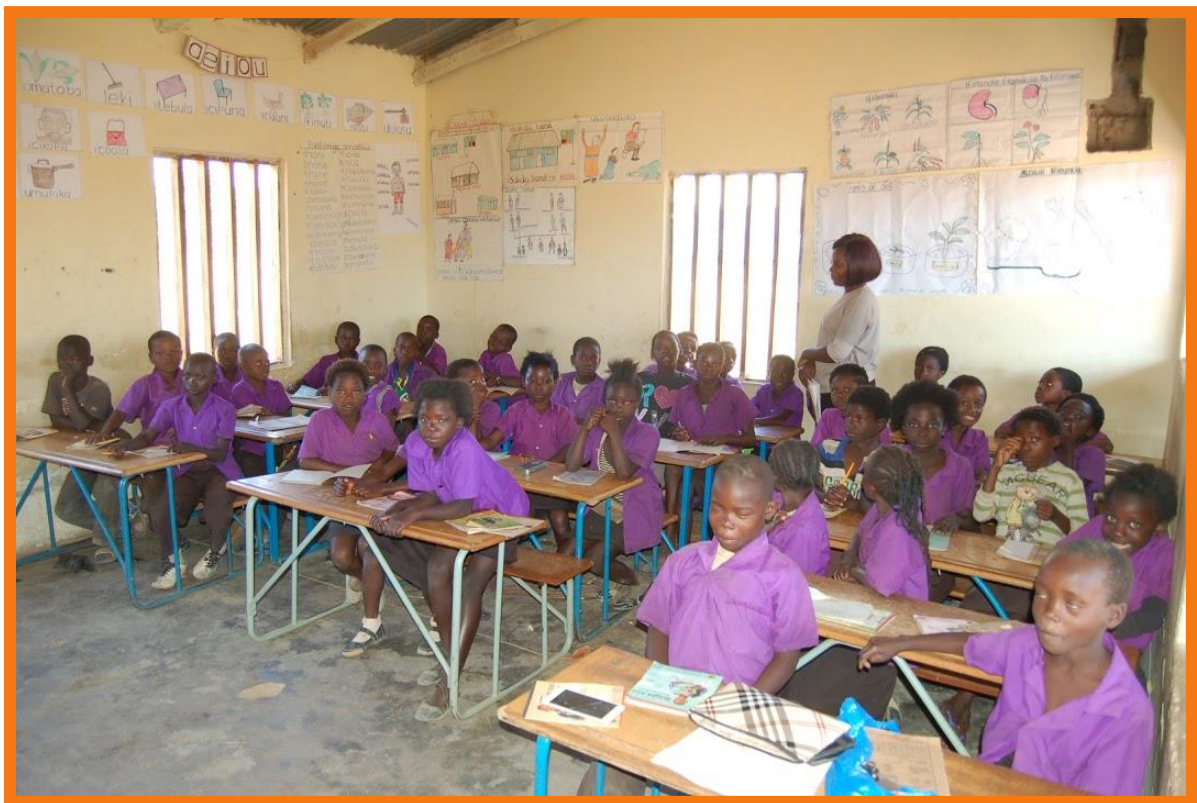
Een klas van de Hoge Primary School in Kalwala..

Soms beseft je pas onderweg waar je aan begonnen bent. Als stichting hebben wij in het begin van deze eeuw de overgebleven familie van twintig Zambiaanse kinderen beloofd dat we voor hen zouden zorgen. Dat blijkt vooral de laatste jaren een enorme uitdaging. Het levensonderhoud en de studie van de kinderen wordt steeds duurder. Niet in de laatste plaats omdat de kinderen eigenlijk geen kinderen meer zijn, maar jong volwassenen. Maar beloofd is beloofd. Ook dit jaar is het weer gelukt om de opleidingen van de kinderen te bekostigen met behulp van veel mensen in Nederland die deze kinderen in hun hart gesloten hebben. Dit elfde jaarverslag beschrijft de activiteiten van het jaar 2019. Voor een overzicht van de historie van onze stichting verwijzen we naar het jaarverslag van 2009. Het voornaamste doel van het jaarverslag is het informeren van onze donateurs en andere belangstellenden over de behaalde resultaten. Wij streven naar een zo groot mogelijke transparantie.