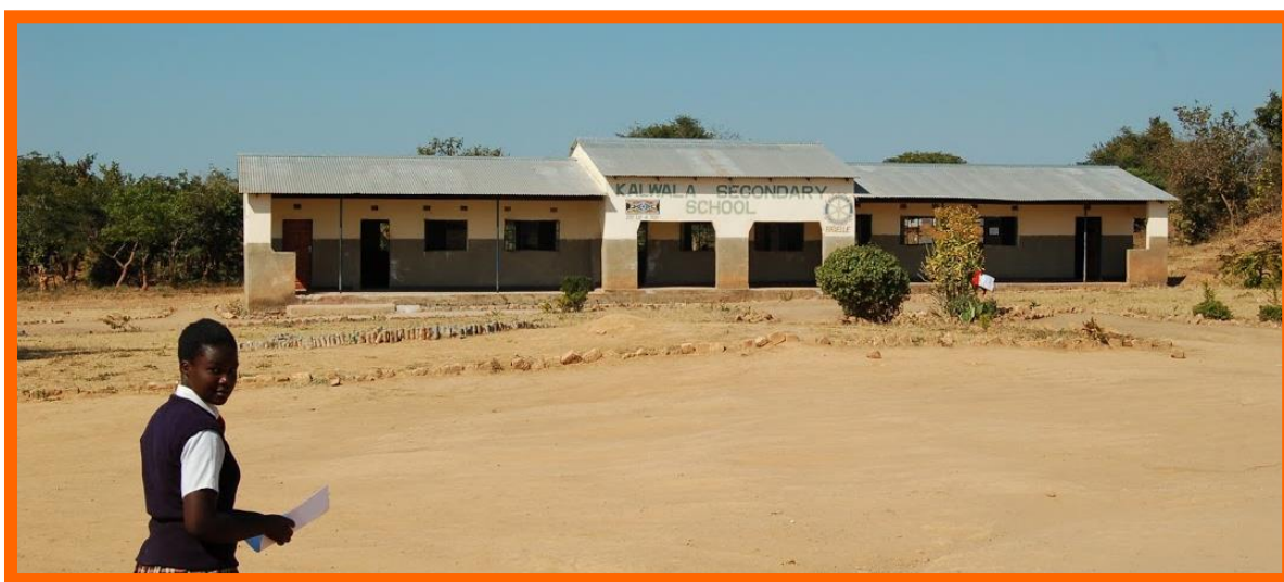
De middelbare school in Kalwala