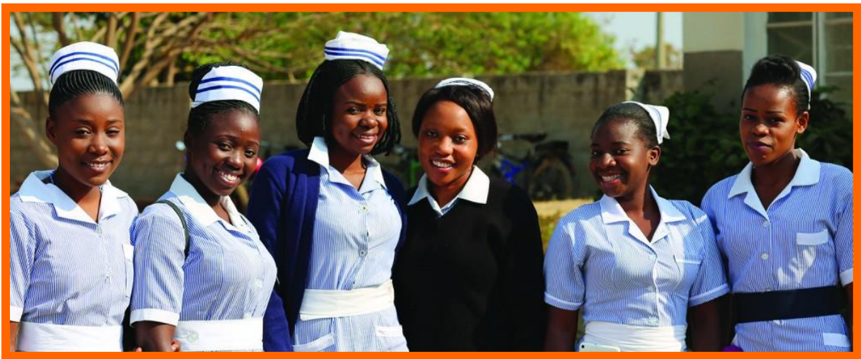
Verpleegsters in opleiding.

De grootste financiële uitdaging voor de stichting wordt gevormd door de zeer hoge studiekosten van de weeskinderen. Tot nu toe waren de gemiddelde maandelijkse inkomsten van de stichting genoeg om voor het levensonderhoud van de weeskinderen te kunnen zorgen. Maar nu de meeste de leeftijd hebben bereikt dat ze naar het tertiair onderwijs kunnen doorstromen, rijzen de kosten de pan uit. Hoewel het gemiddelde inkomen en de levensstandaard in Zambia veel lager zijn dan in Nederland, zijn de studiekosten voor een hogeschool of Universiteit ongeveer hetzelfde als hier, ruim tweeduizend euro per jaar. Dat betekent vanzelfsprekend dat studeren iets is voor de rijke elite. Met een gemiddeld inkomen kan een Zambiaan zijn kind niet laten studeren. Het is al voorgekomen dat ouders hun huis moeten verkopen om voor hun dochter een opleiding tot verpleegkundige te kunnen financieren. Een onwenselijke situatie die we als stichting helaas niet op korte termijn kunnen veranderen.