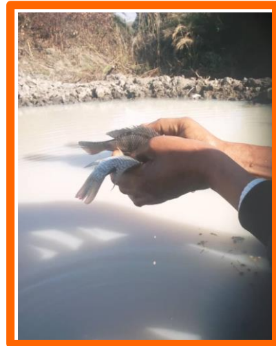
De eerste vissen zijn uitgezet!

Andere initiatieven worden in de nabije toekomst uitgewerkt, zoals het vervaardigen en verkopen van mango jam door de vrouwenclub en het verhuren van de eenvoudige lodges aan backpacker toeristen. Voor dit laatste initiatief is er contact geweest met reisorganisaties die reizen organiseren in Zambia. Voor toeristen is dit een uitgelezen mogelijkheid om het echte Afrika te leren kennen.