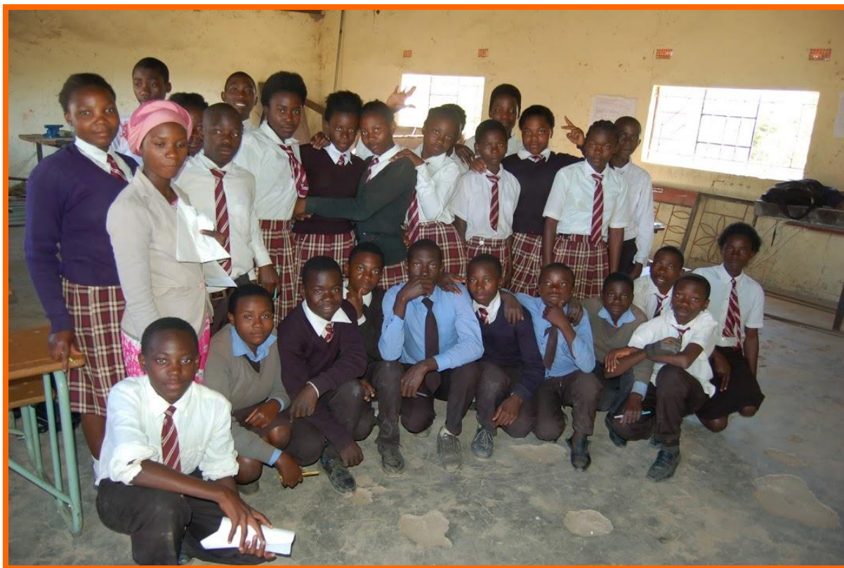
Wiskunde-les op de middelbare school..

De middelbare school heeft met eigen middelen twee lokalen gebouwd en deze zijn in 2019 in gebruik genomen. In de toekomst zijn er waarschijnlijk nog wel meer lokalen en vooral hostels (slaapzalen) nodig. De middelbare school wil ook graag een permanent science-laboratorium bouwen, maar dat is een kostbare aangelegenheid.