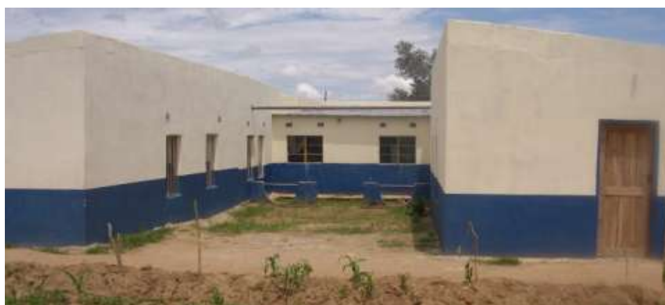
de nieuwe slaapzalen